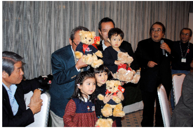
テディベアをプレゼント！