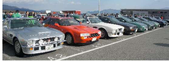
V8, V8 Vantage Zagato, V8 Volante