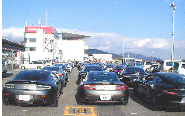
V8 Vantage (Left) 、 and others