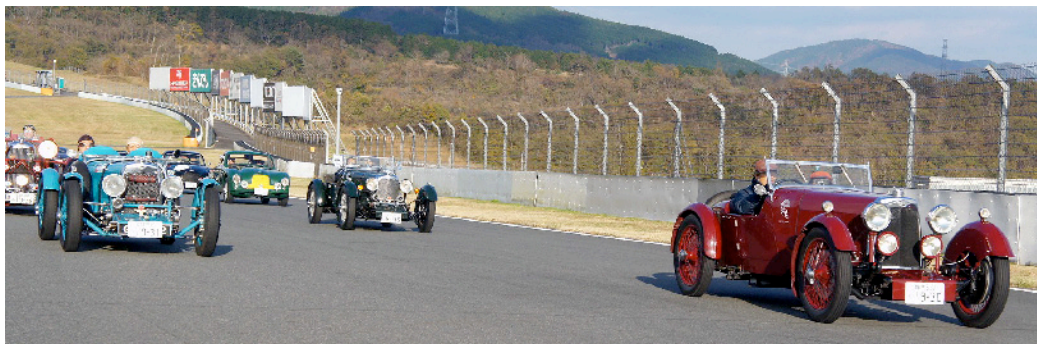
←(1931) International Series I (1930)→