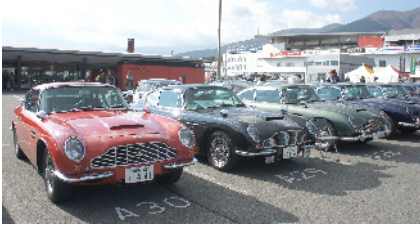
DB6 MK II Series