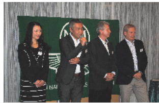
AMAP /オール・スタッフ