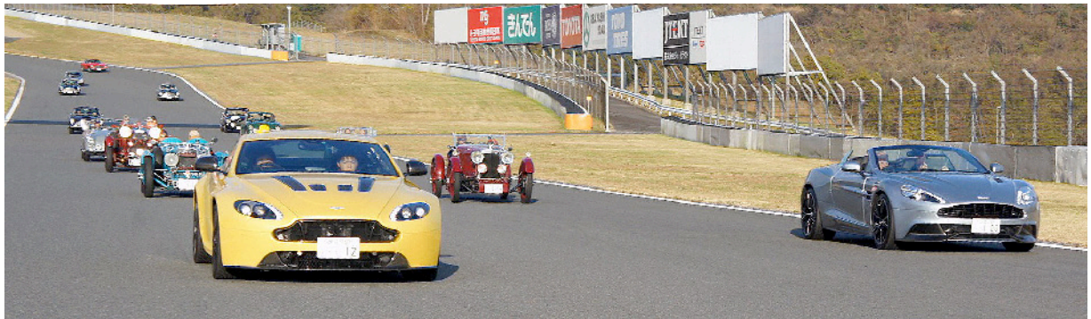
Pace Car / V12 Vantage S