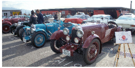
Lagonda LG45, Le Mans, and International