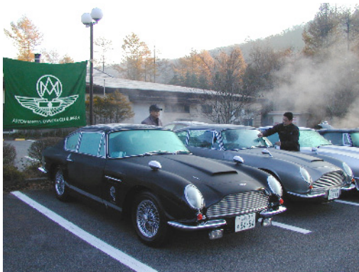
凍てつく朝もやの中のアストン